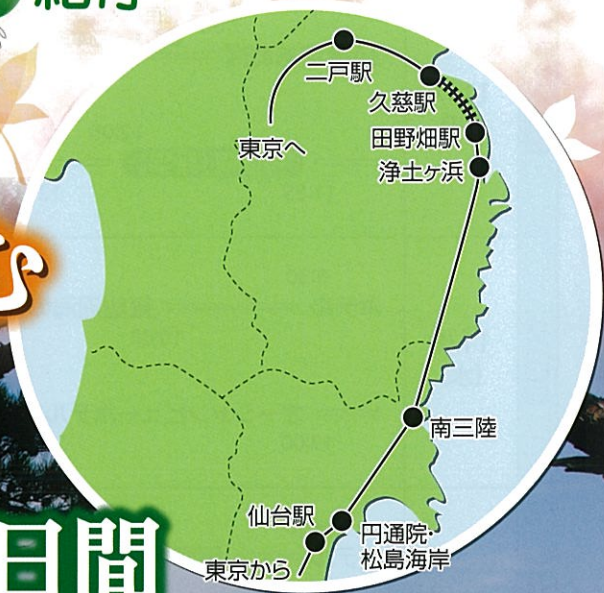
浄土ヶ浜 (イメージ)